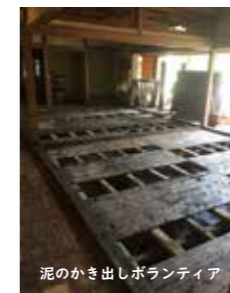
泥のかき出しボランティア